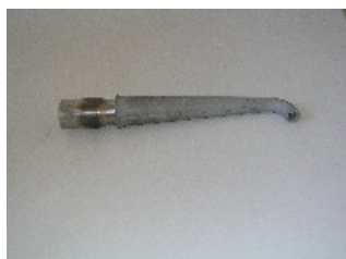
115283 Gumminippel gebogen \varnothing 40x1 mm mit Anschluss V2A