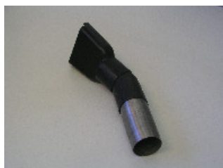
115202 Flachsaugdüse \varnothing 52x1 mm, schwarz mit Anschluss V2A, breite 120 mm