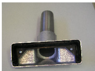
115300 Rechtecksaugdüse \varnothing 52x1 mm, Alu mit Anschluss V2A, breite 200 mm