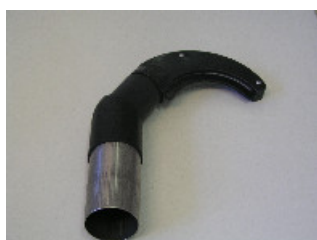
115180 Rohrsaugdüse \varnothing 52x1 mm, schwarz mit Anschluss V2A, für Rohre \varnothing 100 mm